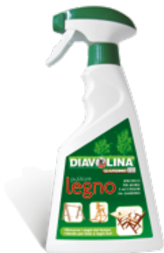
Pulitore Legno 500 ml Cleaner for wooden furniture

Rimuove i segni del tempo da mobili e complementi di arredo per esterni. Ideale per legni duri e teak, agisce in profondità rispettando la struttura del legno. Adatto anche per rattan e bambù.