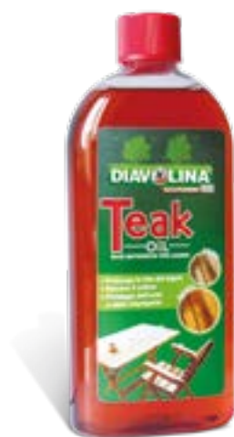
Teak Oil 500 ml Nourishing oil for wood

CODICE PZ/BOX EAN PRODOTTO 15372 6 8002840153726